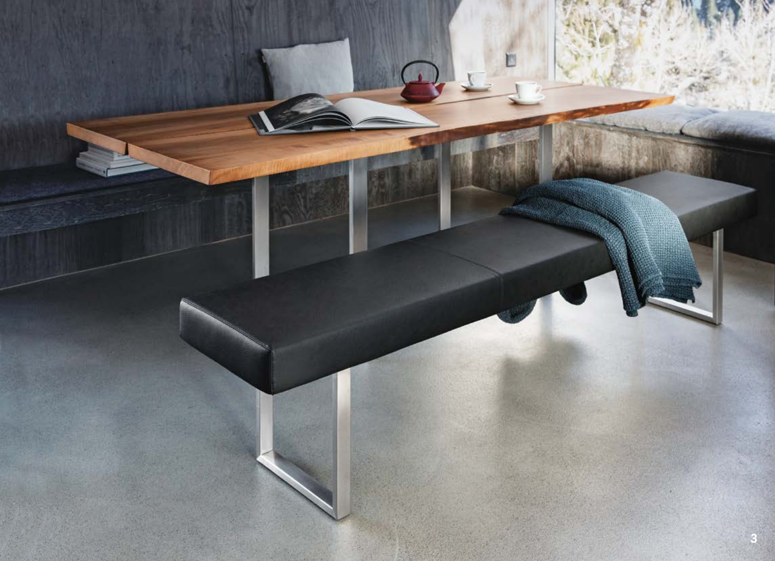
Bildlegenden: Bild 1, Tisch Max, Stuhl Lynn. Bild 2, Tisch Yoho. Bild 3, Tisch Authentic. Légendes : Illustration 1, table Max, chaise Lynn. Illustration 2, table Yoho. Illustration 3, table Authentic.

Girsberger AG, Bützberg, CH Girsberger France, Paris, F Girsberger GmbH, Endingen, D Girsberger Benelux BV, Amsterdam, NL Tuna Girsberger Tic. AS, Silivri, TR