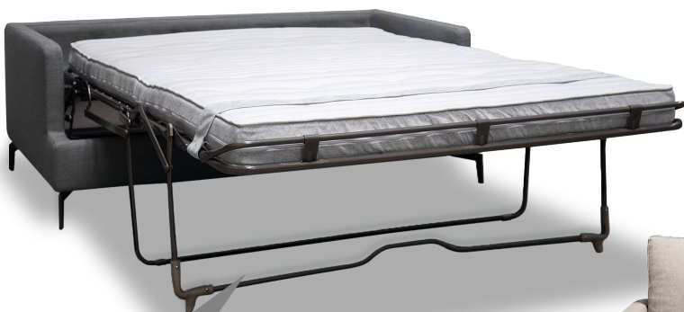
Schlafsofa Leonardo 2.5

Leonardo verwandelt mit seiner soften Sitz- und Rückenpolsterung sowohl Wohn- als auch Gästezimmer in eine echte Wohlfühlzone. Mit seiner großzügigen Sitztiefe, der Sitzkissenfüllung aus Kalt- und Viscoschaum sowie der Rückenkissenfüllung aus in Kammern gefüllten Luftzellenstäbchen lädt dieses Modell tagsüber zum ungestörten Entspannen ein. Am Abend sind nur wenige Handgriffe nötig, damit Leonardo seine Qualitäten als gemütliches Bett mit lose aufliegender Matratze und einer Bodenfreiheit von 12 cm unter Beweis stellen kann. Je nach gewünschtem Komfort stehen dafür die serienmäßige PUR-Matratze oder eine punktelastische Kaltschaummatratze mit abgestepptem Bezug aus Doppeltuch zur Auswahl. Besonders praktisch: Bei der Variante in Stoff kann der Bezug bei Bedarf abgenommen und gereinigt werden.