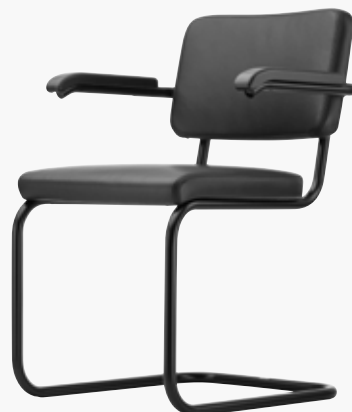
S 64 PV VOLL UMPOLSTERT FULL UPHOLSTERY