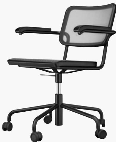
S 64 NDR NETZGEWEBE 2, SCHWARZ MESH 2, BLACK