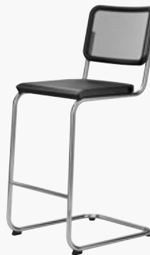
S 32 NH NETZGEWEBE 2, SCHWARZ MESH 2, BLACK