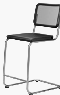
S 32 NHT NETZGEWEBE 2, SCHWARZ MESH 2, BLACK