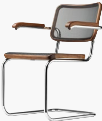
S 64 N PURE MATERIALS SITZ, RÜCKEN UND ARMAUFLAGEN EICHE, ESCHE ODER NUSSBAUM GEÖLT SEAT, BACKREST AND ARMREST OAK, ASH OR WALNUT OILED