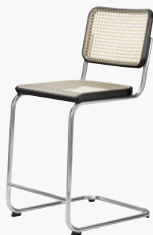
S 32 VHT ROHRGEFLECHT, MIT KUNSTSTOFFSTÜTZGEWEBE CANE WORK, WITH SUPPORTING SYNTHETIC MESH