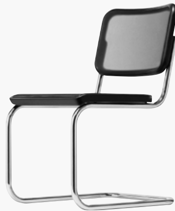
S 32 N NETZGEWEBE 2, SCHWARZ SYNTHETIC MESH 2, BLACK