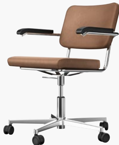
S 64 PVDR VOLL UMPOLSTERT FULL UPHOLSTERY