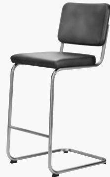
S 32 PVH VOLL UMPOLSTERT FULL UPHOLSTERY