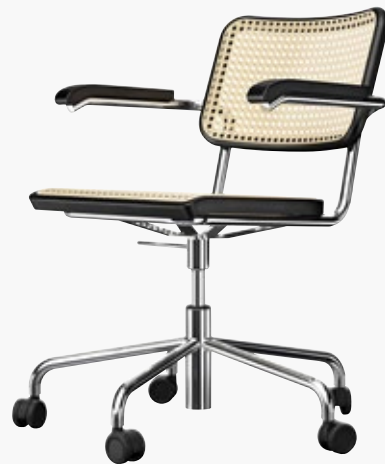
S 64 VDR ROHRGEFLECHT, MIT KUNSTSTOFFSTÜTZGEWEBE CANE WORK, WITH SUPPORTING SYNTHETIC MESH