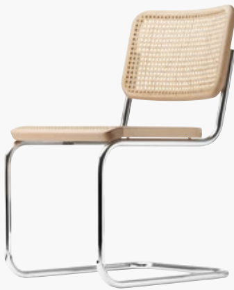
S 32 V ROHRGEFLECHT, MIT KUNSTSTOFFSTÜTZGEWEBE CANE WORK, WITH SUPPORTING SYNTHETIC MESH