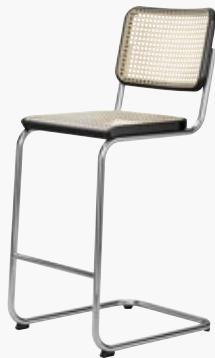
S 32 VH ROHRGEFLECHT, MIT KUNSTSTOFFSTÜTZGEWEBE CANE WORK, WITH SUPPORTING SYNTHETIC MESH