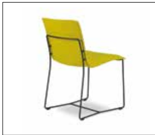
chair with undercarriage epoxy black stoel met onderstel epoxy zwart Stuhl mit Untergestell Epoxy schwarz chaise avec piètement epoxy noir