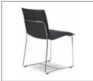
chair with undercarriage chrome high-gloss stoel met onderstel chroom hoogglans Stuhl mit Untergestell Chrom Hochglanz chaise avec piètement chrome brillant