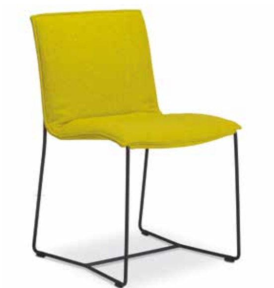
fabric divina melange 421 : chair undercarriage epoxy black