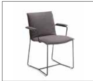
chair with open armrests stoel met open armleggers Stuhl mit offenen Armlehnen chaise avec accoudoirs ouverts